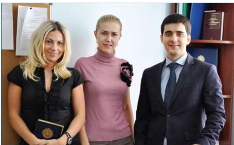
Відділ статистично-аналітичної роботи