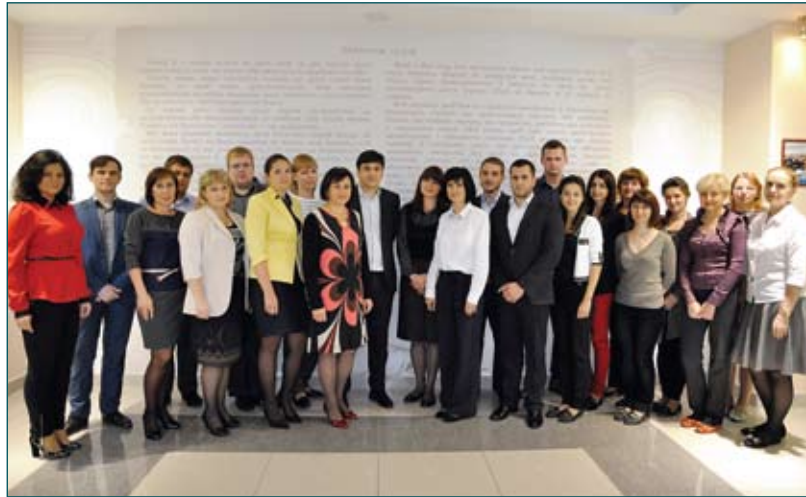
Департамент з питань суддівської кар'єри