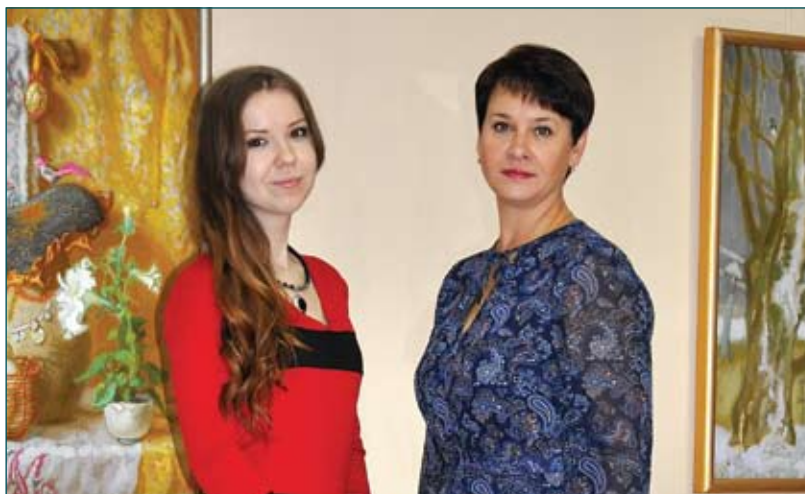
Сектор організаційної роботи та забезпечення діяльності керівництва секретаріату Комісії