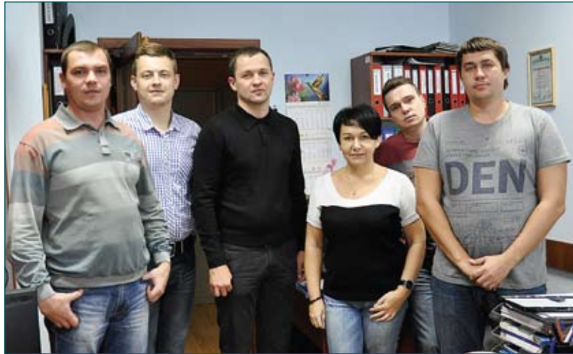
Управління інформаційних технологій