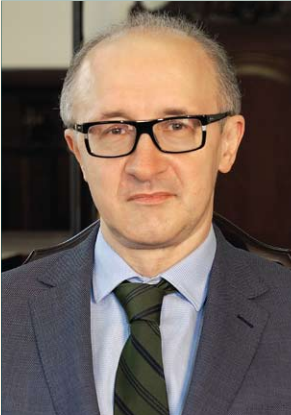
Козьяков Сергій Юрійович Голова Вищої кваліфікаційної комісії суддів України