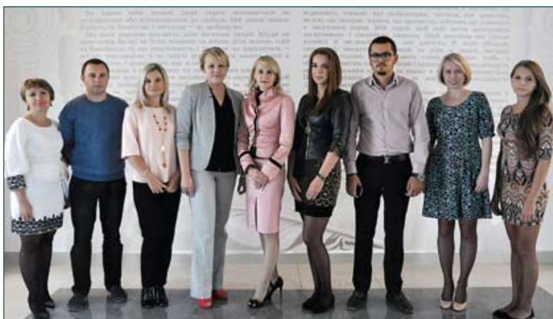
Відділ підготовки засідань дисциплінарної палати та організації діловодства й відділ підготовки засідань кваліфікаційної палати та організації діловодства