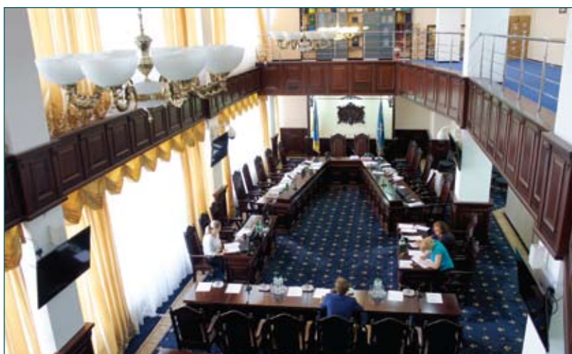
Зал засідань Комісії