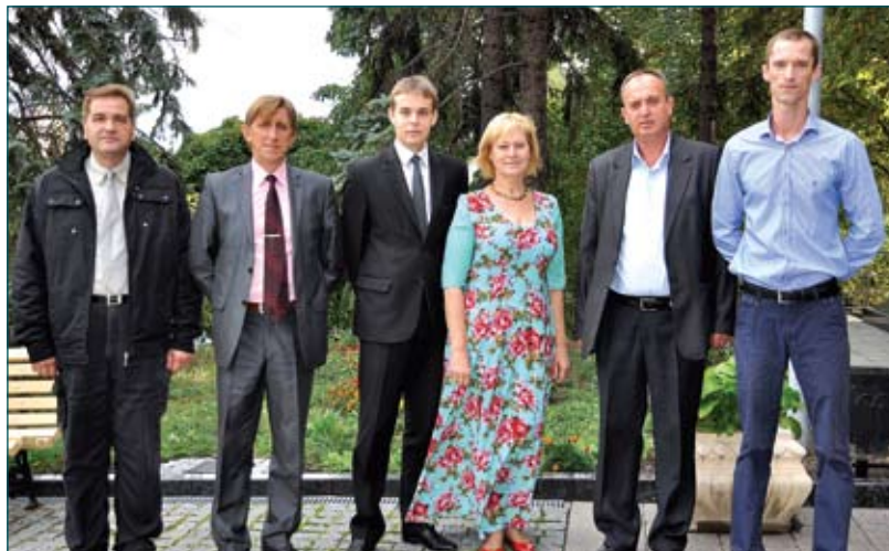
Відділ господарського та транспортного забезпечення