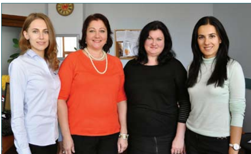
Сектори літературного редагування та видавничої діяльності