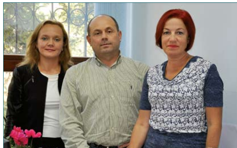
Відділ з питань доступу до публічної інформації, прийому та звернень громадян