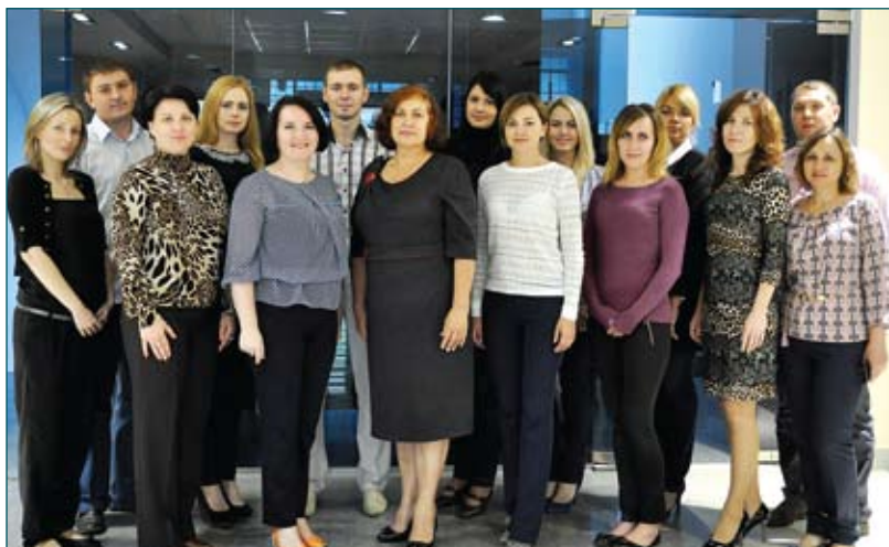
Управління документального забезпечення