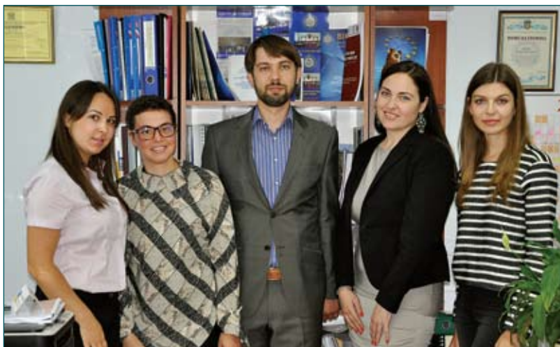
Відділ міжнародного співробітництва