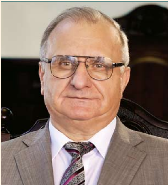
Патрюк Микола Васильович Заступник Голови Вищої кваліфікаційної комісії суддів України