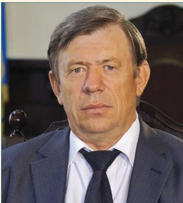
Макарчук Михайло Андрійович Секретар дисциплінарної палати Вищої кваліфікаційної комісії суддів України