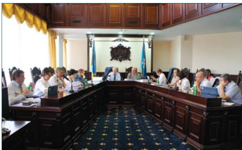
Члени Комісії ухвалюють рішення