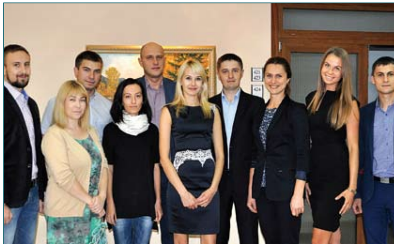
Департамент з питань професійної кваліфікації суддів та кандидатів на посаду судді