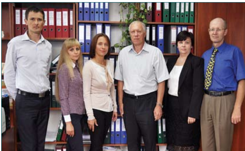
Відділ по роботі з персоналом