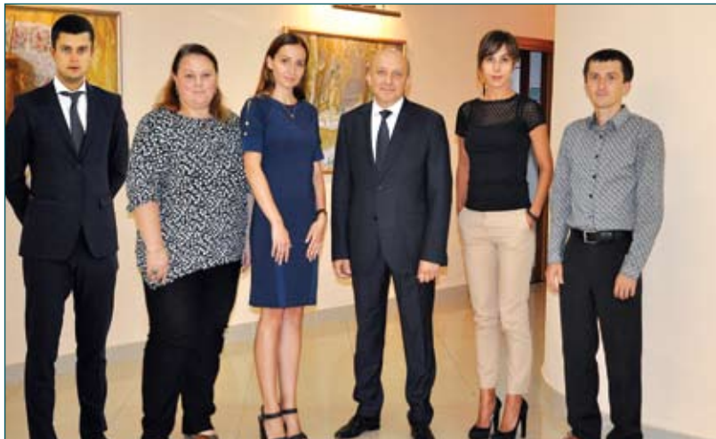
Відділ забезпечення діяльності Голови Комісії